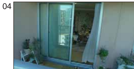
私たちはどこまで知っているだろう。