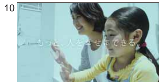
もっと、人を幸せにできる。