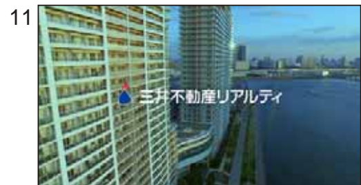
【NA】三井不動産リアルティ