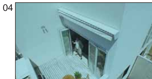
【NA】家の売り買いは、どこまで人生を豊かにしているだろう。