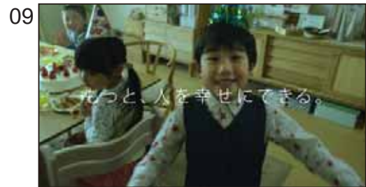
もっと、人を幸せにできる。