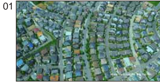
「JUST THE WAY YOU ARE」 ~