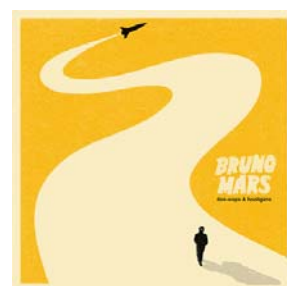
「ジャスト・ザ・ウェイ・ユー・アー」 収録アルバム:『ドゥー・ワップス & フーリガンズ』(ワーナーミュージック・ジャパン) (WPCR-14146)

2011 年の第 53 回グラミー賞では「最優秀男性ポップ・ヴォーカル賞」、2014 年の第 56 回グラミー賞では「最優秀ポップ・ヴォーカル・アルバム賞」を受賞した。