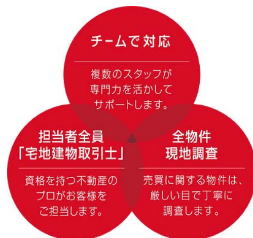
リハウスの3つの約束

物件の正確な情報をお届けし、お客様に安心して取引していただくために、お預かりしたすべての物件を、専門知識に基づき丁寧に調査します。「三井のリハウス」ホームページに掲載している物件情報は、すべて調査済みです。