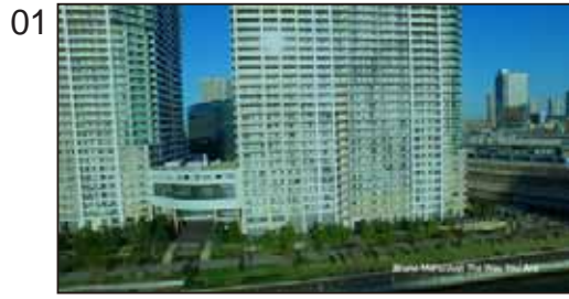
「JUST THE WAY YOU ARE」～