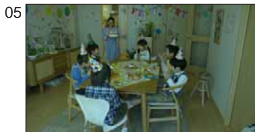
場所や広さだけでなく、