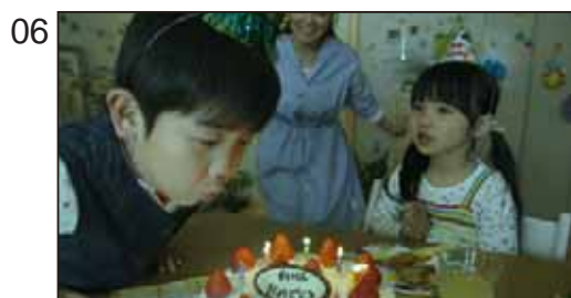
生活の息吹まで伝えられること。