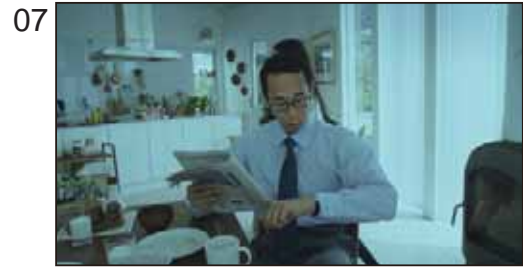
不動産の紹介を越えて、