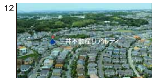
【NA】三井不動産リアルティ