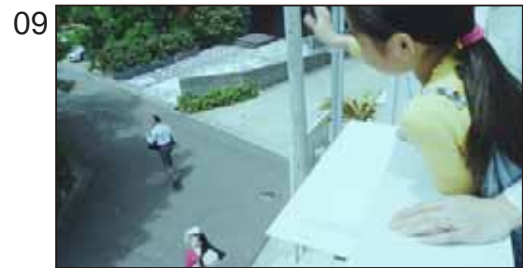
あなたとご家族の人生設計までも。