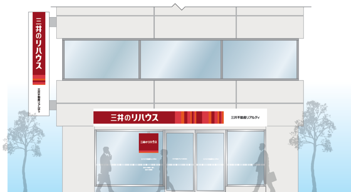
店舗サイン展開イメージ

新ブランドロゴとサブグラフィックの組み合わせを「コミュニケーションマーク」として、展開していきます。