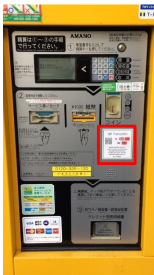
QRコード表示イメージ