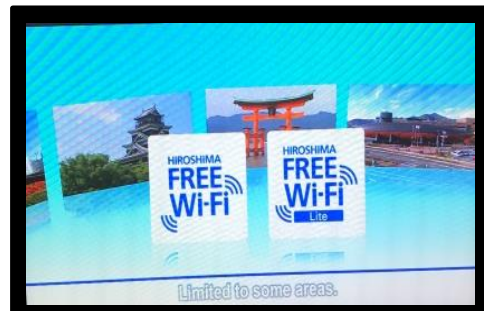
観光コンテンツ(広島市)