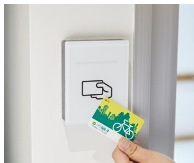
<ICカードによるセキュリティ>