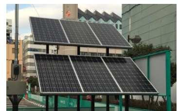
[ハイブリッドソーラーシステム]

日照時に4枚のソーラーパネルで太陽光による発電を行い、蓄電された電力で夜間に看板のLED照明を点灯、災害時や停電時にも機能します。最大で1日に約3498Wh発電することができ、場内の看板照明の消費電力量の約62.6%を供給することが可能です。本システムの導入により、年間で約817kgのCO2排出量の削減が見込めます。また、災害時には、備え付けのコンセントから、携帯電話やラジオの充電を行うことも可能です。