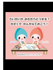
サインージコンテンツ