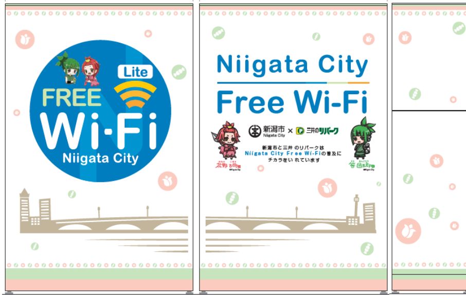
高機能自動販売機（背面）