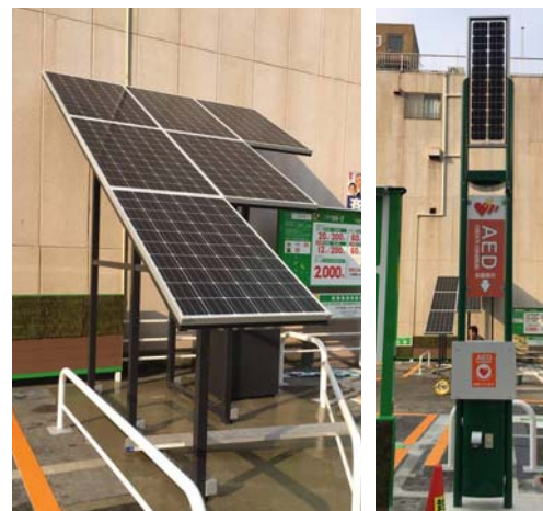
左:ハイブリッドソーラーシステム

日照時に6枚のソーラーパネルで太陽光による発電を行い、蓄電された電力で日没後の看板・照明機器を点灯させるシステムです。最大で日に約4,770W発電することができ、場内の看板・照明機器の消費電力量を約98%供給することが可能です。本システムの導入により、年間で約893kgのCO 2 排出量の削減が見込めます。