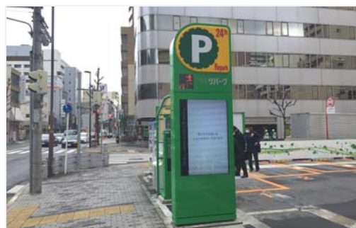
パイロン型P看板(デジタルサイネージ付)

入口に設置するP型看板に、デジタルサイネージパネルを搭載しました。企業広告や近隣の観光案内やサービス券提携店情報等の発信を予定しています。