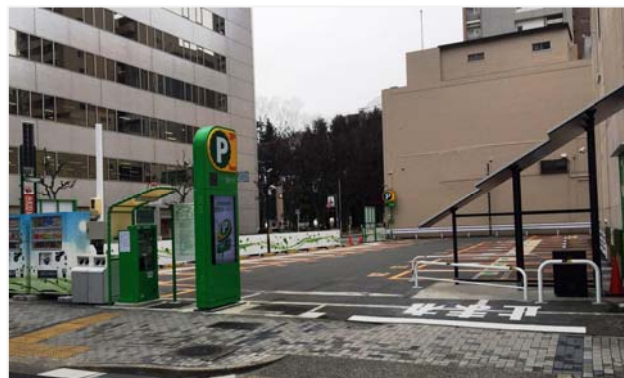
「三井のリパーク」栄2丁目駐車場全景

本件については、以下の記者クラブへ資料を配布しております。 国土交通記者会・国土交通省建設専門紙記者会・自動車産業記者会・名古屋経済記者クラブ