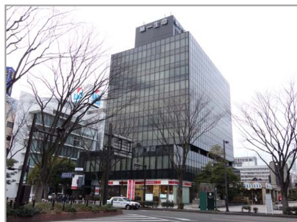
<仙台第一生命ビル>